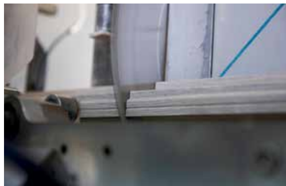
Taglio della barra