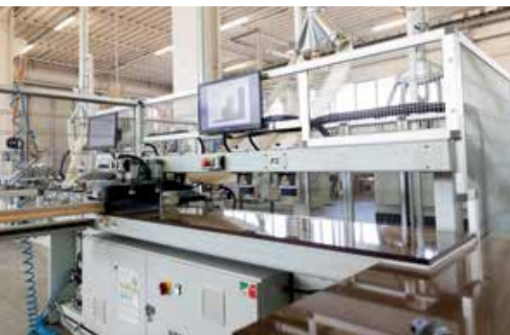
Centro di lavoro MC900