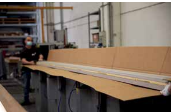
Ricezione delle barre da 6 metri già pronte e finite per essere tagliate

Grazie all'officina produttiva uni_one tutti i produttori di serramenti, siano essi falegnami o serramentisti abituati a lavorare barre in alluminio o pvc, possono produrre soluzioni in legno e alluminio.