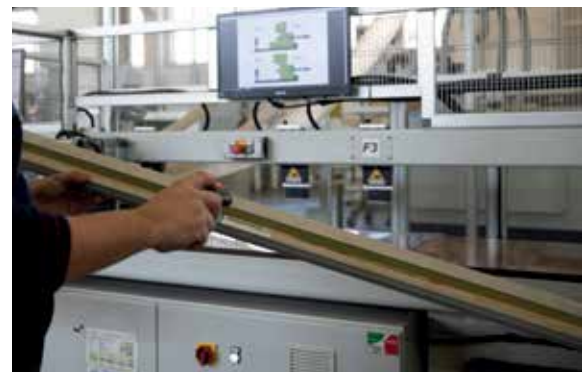
Lettura codice a barre per caricamento automatico lavorazioni nel centro di lavoro MC900