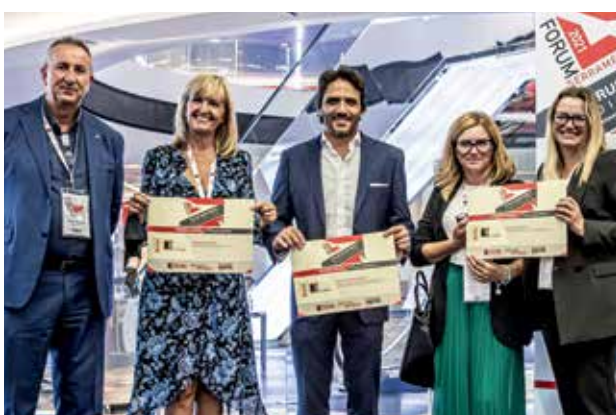
I serramentisti e i rivenditori premiati all'Oscar del Serramento 2021