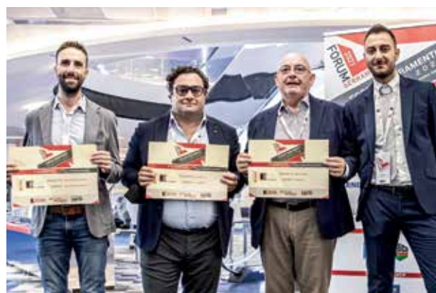
Tutti i vincitori dell'Oscar del Serramento delle quattro categorie in gare: Accessori & Ferramenta, Protezione, Profili e Serramenti Scorrevoli